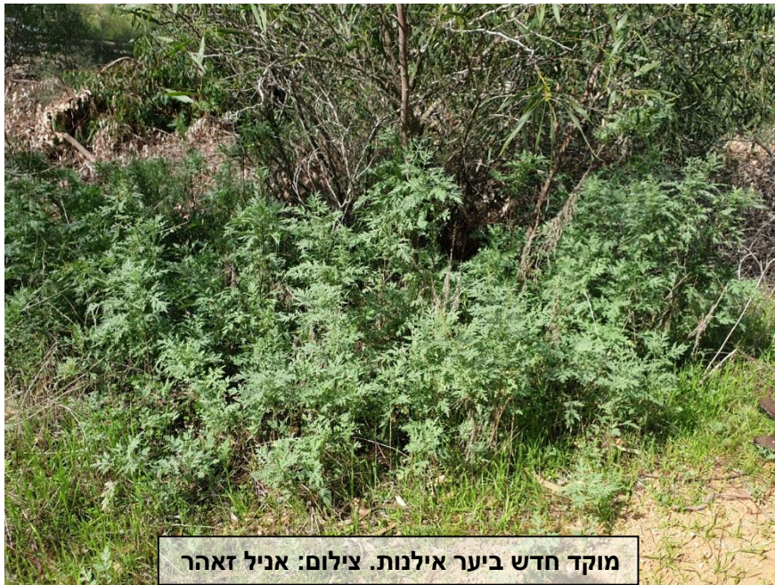
מוקד חדש ביער אילנות.

נערך ע"י : שני גלייטמן, דוד אבלגון, נורית היבשר, יהל פורת, סוהיל זיידן.